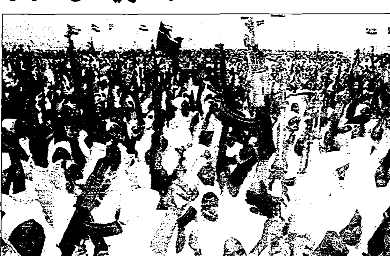
سودانيات يحملن أسلحة ضمن قوات المقاتلين التي تمسدها الخرطوم لواجهة التمرد

هجوم مسلحا تشنه المعارضة حسب ما علم من مقفي حملة التبرع هذه. وأكد امام مسجد في صنعاء مقر من حزب التجمع اليمني للإصلاح الإسلامي المشارك في الائتلاف الحكومي ان جمع التبرعات بدأ الجمعة. وأكدت صحيفة الصبح في صنعاء ان حملة التبرع بدأت في صنعاء في وقت مبكر من يوم الجمعة. وأكدت صحيفة الصبح في صنعاء ان حملة التبرع بدأت في صنعاء في وقت مبكر من يوم الجمعة.